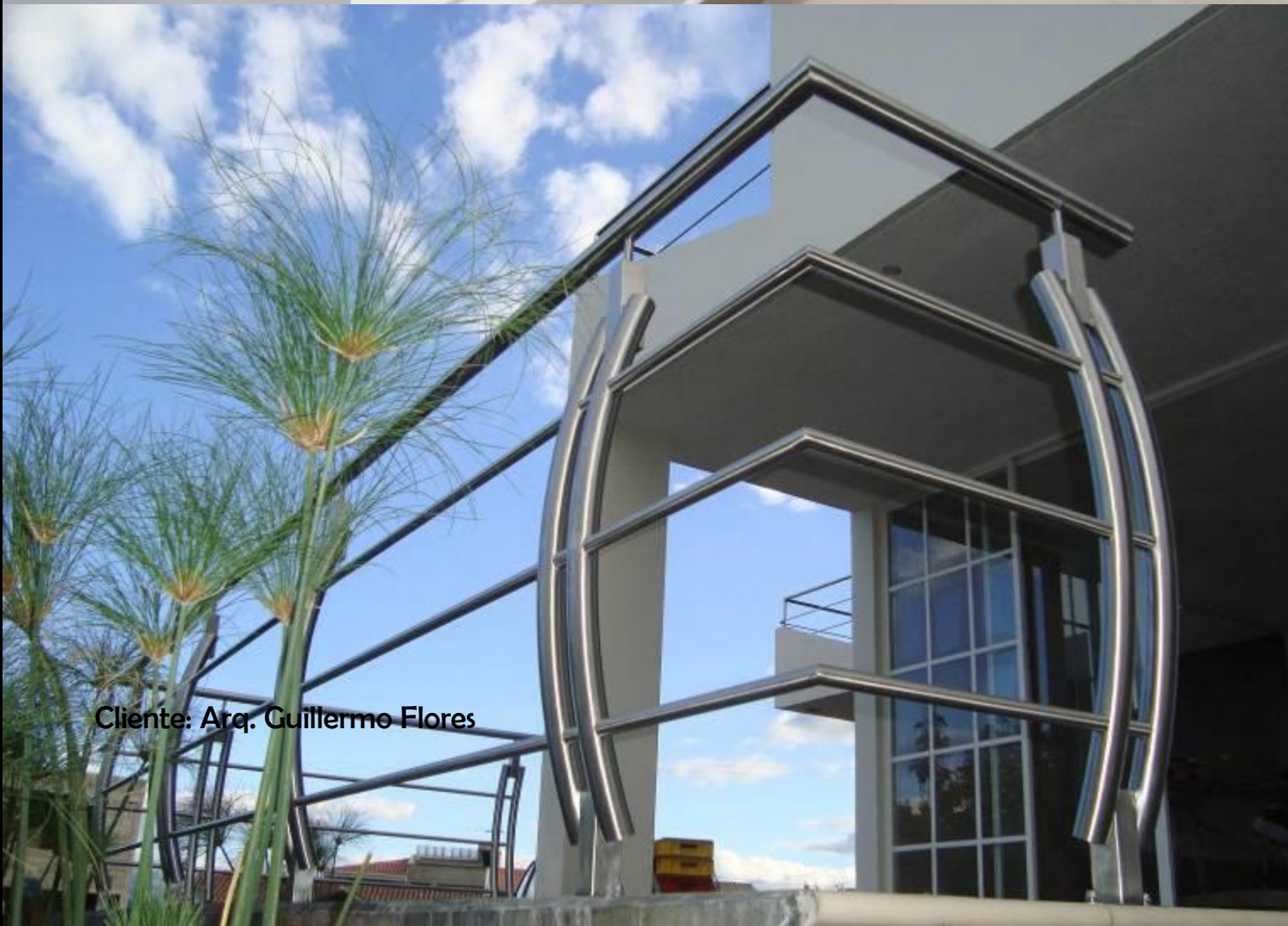
Cliente: Arq. Guillermo Flores