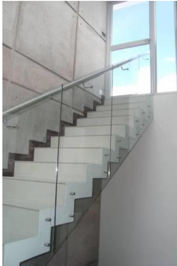
SOLUCIONES INDUSTRIALES METALMACHINE S.C.C.