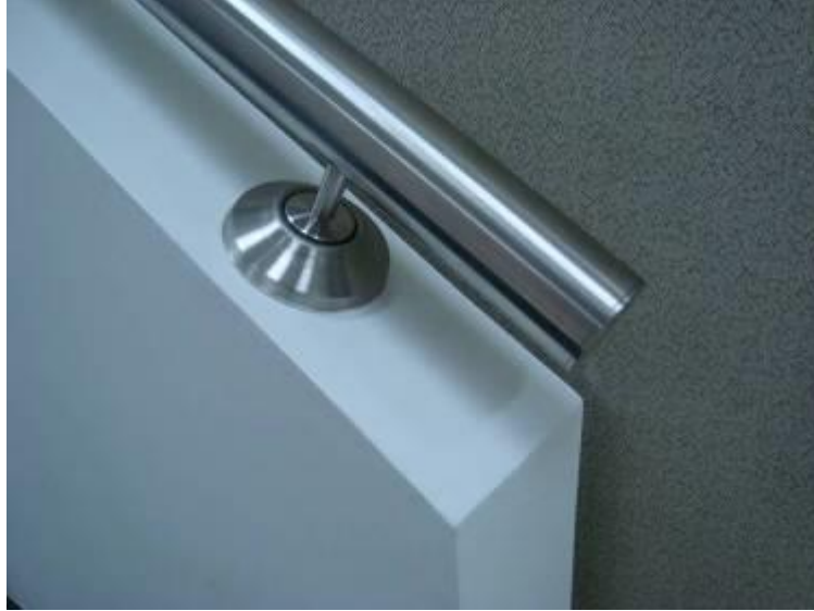
Cliente: Banco Proamerica Quicentro Sur (Arq. Ramiro Larrea)