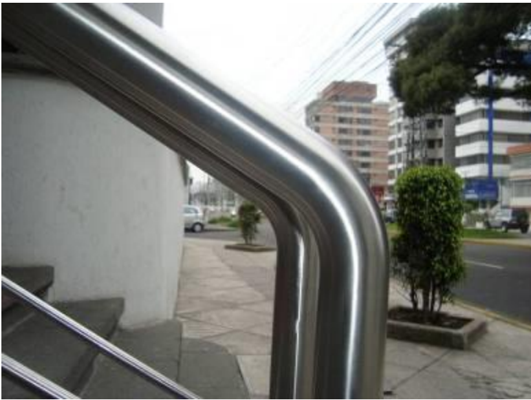
Detalle de dobles.